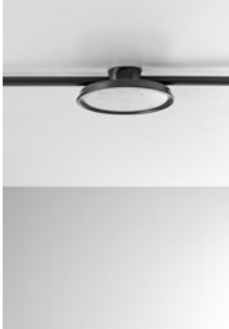
Art. MYM2PL/SYSTEM/NM/BD22 Art. MBLIN22/NM/1