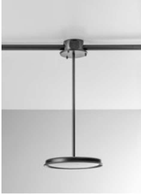
Art. MYM2S/SYSTEM/NM/BD22 Art. MBLIN22/NM/1